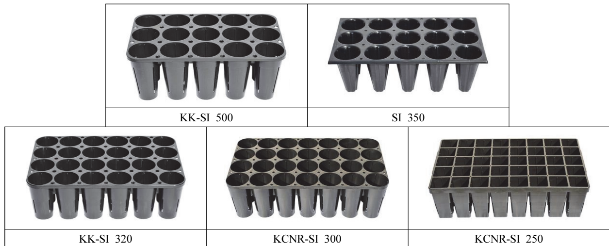
Figure 1. The five containers used for this experiment.