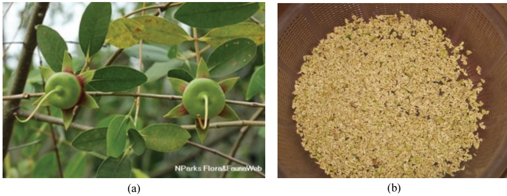
Figure 1. Photo showing the fruits and seeds of S. caseolaris .

(a): fruit state of S. caseolaris (National park board, 2022), (b): seeds of S. caseolaris after refining.